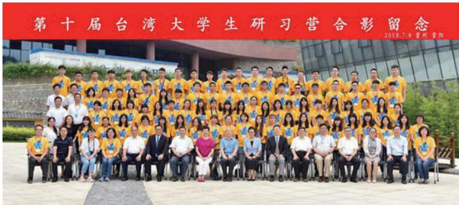
第十届台湾大学生研习营合影留念

我院志愿者表示，通过本次研习营活动，台湾大学生对贵州、对祖国有了更多的了解和认识，我们也对台湾、对台胞有了更深厚的感情。