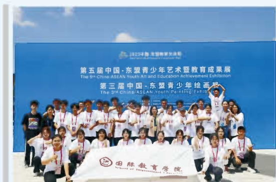
我院学生参加2023中国—东盟教育交流周活动 |