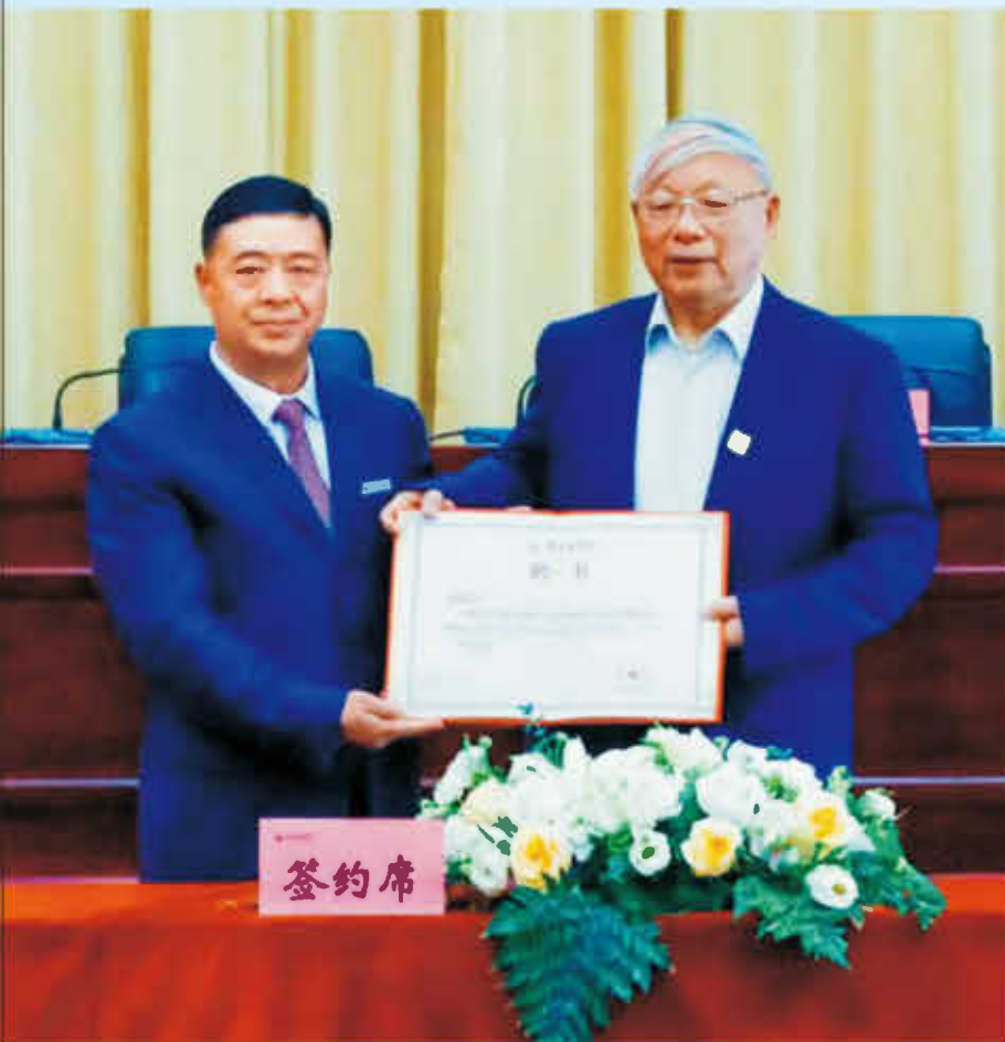
■ 2022年6月15日，贵州商学院柔性引进通信与信息系统专家、中国空间监视技术领域主要开拓者、中国工程院陈鲸院士