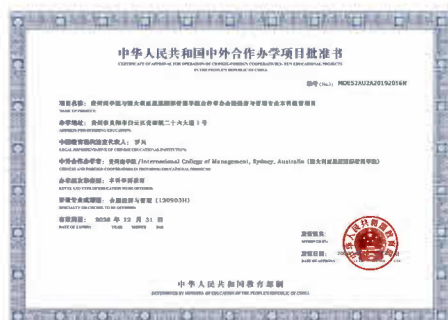
合作办学项目批准书