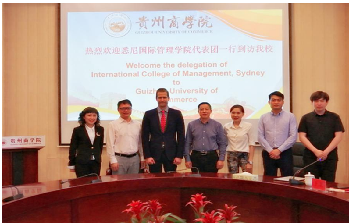
悉尼国际管理学院副校长访问我校