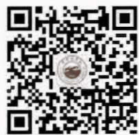
贵州商学院 官方微信公众号

学院是贵州省省属普通本科高校、贵州省第二批本科高校应用型转型发展试点学校。学院以工商管理、应用经济学为主干学科,计算机科学与技术、艺术学为支撑学科,打造面向商务服务业、商贸流通业、生活服务业、商业信息和大数据应用四大专业群,其中会计学、投资学、会展经济与管理,电子商务4个专业为省级一流专业。目前有12个二级学院(部),27个本科专业,在校生规模11000余人。2020年3月,经教育部批准,与澳大利亚悉尼国际管理学院合作举办会展经济与管理专业本科层次中外合作办学项目。