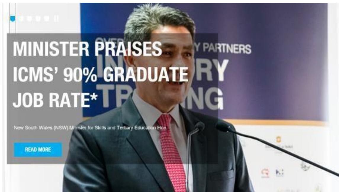
毕业学生就业率达90%