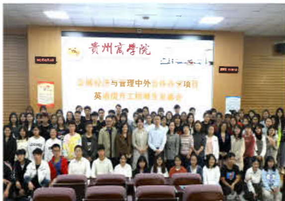
国际教育学院会展经济与管理中外合作办学项目英语提升工程师见面会