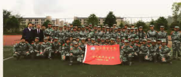
国际教育学院会展经济与管理中外合作办学项目学生军训合照

ICMS课程由众多国际顶级学者与行业专家共同担任执教，校内诸多院系教授为全澳相关学科带头人。学校在澳大利亚高等教育质量与标准署（TEQSA）所做的教学评估中获得了极好的评分，其澳洲会展管理专业和酒店管理专业毕业生的就业能力均排名在澳大利亚首位。