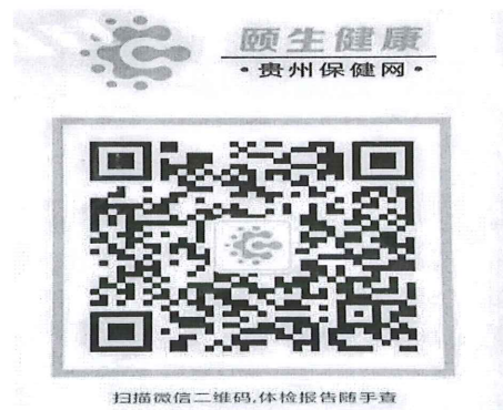
省直在编人员报告查询二维码