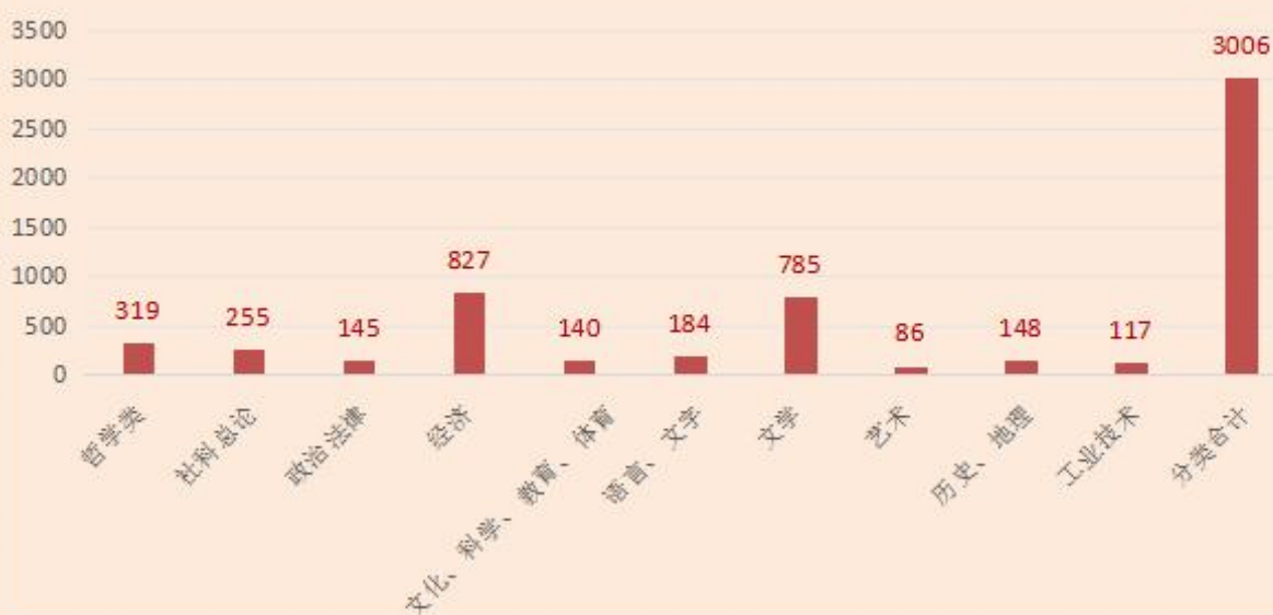
2024年4月图书借阅比例：前十类