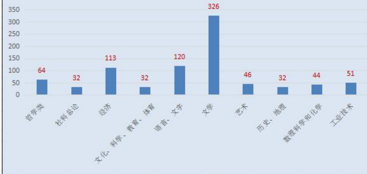
2023年7-9月图书借阅比例：前十类