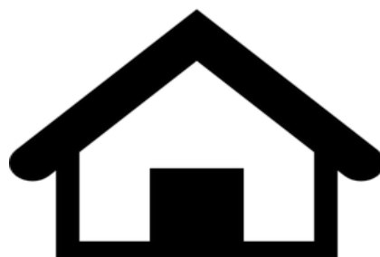
图书馆馆藏总册数