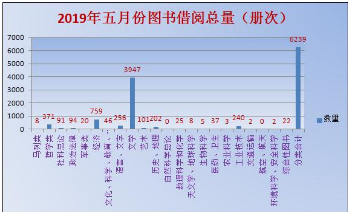
2019年五月份图书借阅总量 文学类在各类图书中占的比例最高