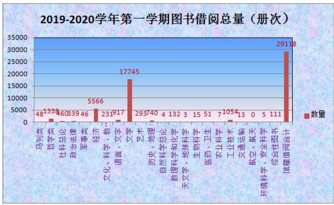
2019-2020 学年第一学期图书借阅总量 文学类在各类图书中占的比例最高