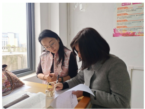
校级教学督导组听课课后与任课老师交流