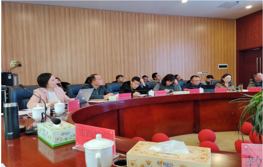
第一次教学工作例会会议现场