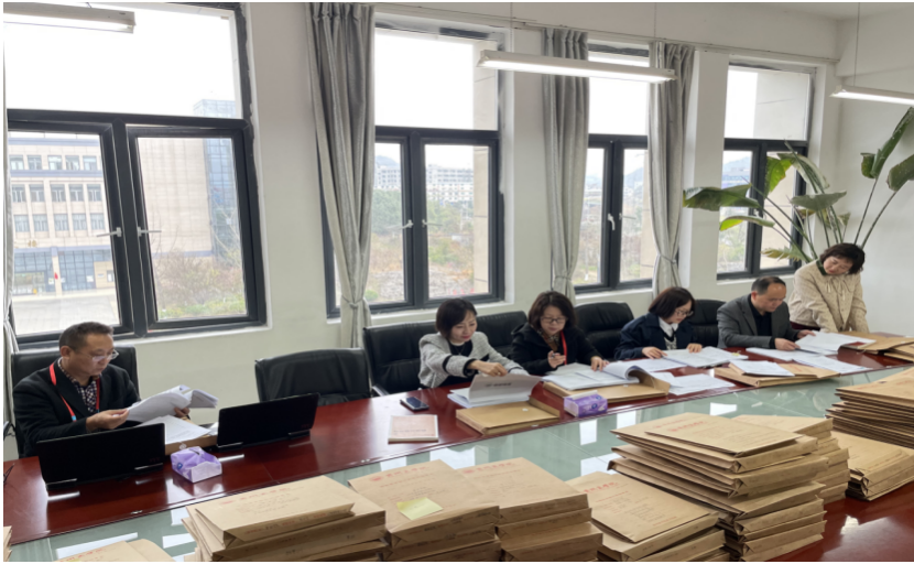
教务处领导参加督导组对管理学院的期初检查