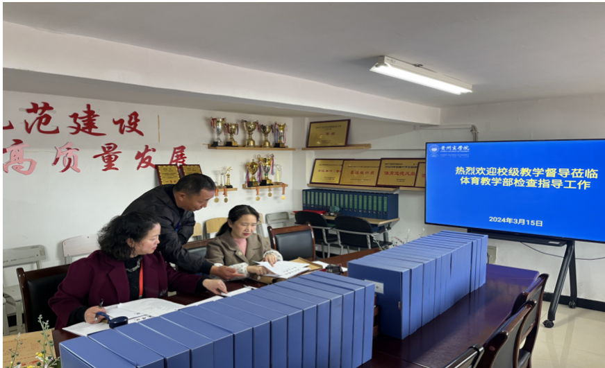
校级教学督导在体育教学部开展期初教学检查

从检查情况看，各教学院部领导对该项工作较为重视，工作落实到位，都按要求提前做好好了检查准备，资料准备充分，以便于督导组检查，资料归档也较为完善。特别是体育教学部领导认真负责，率先垂范，给督导组留下了深刻印象。