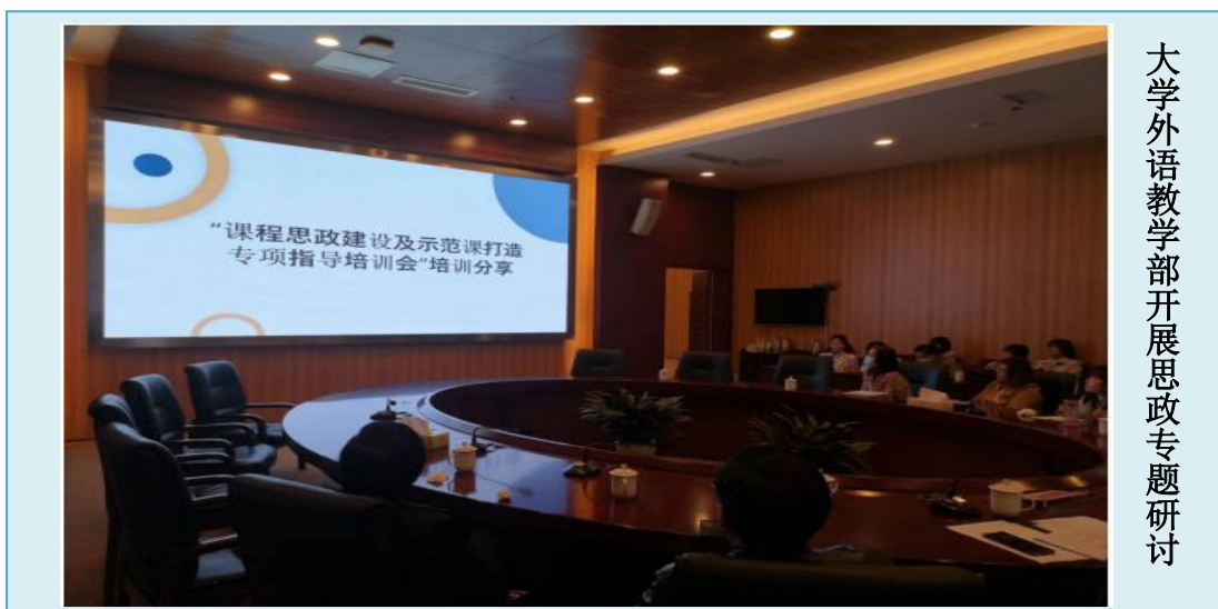
大学外语教学部开展思政专题研讨

为进一步推进课程思政建设，丰富我校外语类课程中课程思政内涵，使课程思政理念与外语学科特色深度融合，2022年11月16日，大学外语教学部（国际教育学院）开展了课程思政专项研讨活动。此次专题研讨与分享活动是对我校近3年以来外语课程思政建设的一次总结与升华，也为深化课程思政建设奠定了基础。接下来，大外部（国教院）将《习近平总书记教育重要论述讲义》融入教学内容，同时开展课程思政示范课建设。