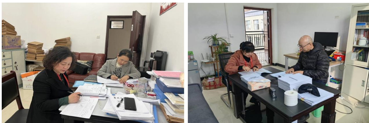
校级督导进行期中教学检查

文化与艺术传媒学院、经济与金融学院、旅游管理学院、管理学院、通识教育学院、马克思主义学院、大学外语教学部（国际教育学院）十个教学院（部）的教学资料进行期中专项检查，检查内容包括课程教学中课程思政元素安排情况、教学常规及教学管理制度执行情况、教学文件规范及存档情况等。从检查情况看，各教学院（部）都提前进行了二级督导检查，课程大纲中都按要求补充了思政元素，教学工作按计划推进，教学日志基本与教学计划一致，教学文件较为规范。