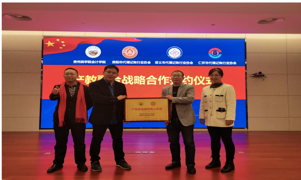
贵阳市代理记账行业协会向会计学院赠送产教融合协同育人基地的牌子