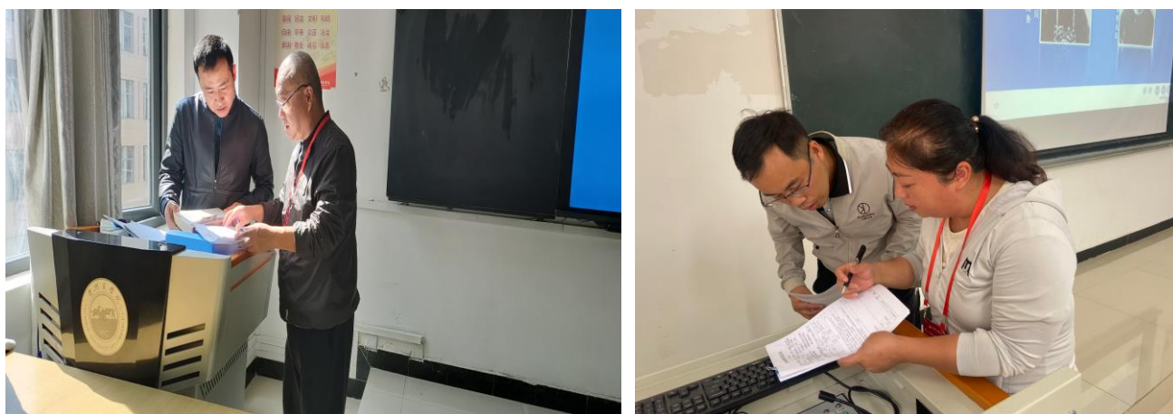
校级督导听课及与任课老师交流