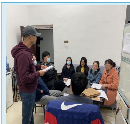
军事理论教研室开展安全教育进课堂教学研究活动

今年 4 月 15 日是第七个全民国家安全教育日，为做好国家安全教育工作，牢固树立学生的国家安全意识，提高学生维护国家安全的能力，军事理论教研室组织开展了“国家安全教育进课堂”活动。本次活动围绕今年全民国家安全教育日主题，充分利用线上线下资源，积极引导學生正确理解、认真践行总体国家安全观，以实际行动维护和塑造国家安全。