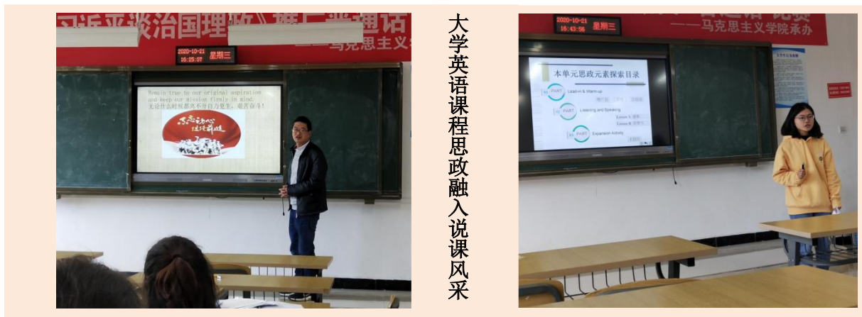
大学英语课程思政融入说课风采

为深化教师对课程思政教学的理解，推动大学外语课堂思政教育落地见效，大学英语教研室组织老师进行了别开生面的大学英语课程思政集体备课活动。活动分为三个阶段：集中学习部署阶段、分组讨论阶段和集体分享阶段。此次活动把老师们分为大学英语 1、大学英语 3 两个大组，大组下又分成读写课和听说课两种课型进行集体备课，主要围绕如何把课程思政融入教学大纲、如何挖掘本学期选用教材中课程思政元素以及如何在外语课堂中实现课程思政进行探讨。集体备课成果以小组汇报和小组代表说课的形式呈现，这次活动加深了老师们对课程思政理念的认识，为下一步大学外语课程思政教学改革奠定了良好基础。