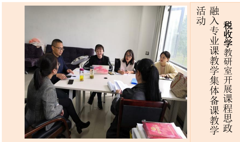
税收学教研室开展课程思政融入专业课教学集体备课教学活动

教育部要求课程思政要融入专业课教学之中。为贯彻这一指示精神，税收学教研室组织教师对本学期开设的专业课程就其教学中如何与思想政治内容有机融合讲授进行了深入的研究。老师们一致认为：立德树人、爱国诚信是税收学专业的立身之本，所有专业课都有育人功能，要充分挖掘产业与专业课程的思政资源，把做人做事的基本道理、把社会主义核心价值观的要求、把实现中华民族伟大复兴的理想和责任融入到专业课堂教学中，激励学生自觉把个人的理想追求融入国家和民族的事业，只有这样，才能培养担当民族复兴大任的时代新人。随后老师们对本学期开设的专业课程逐一进行课程思政教学设计研讨。