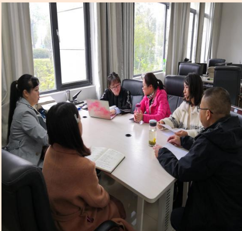
投资学教研室开展实践教学研究活动

为贯彻落实我校“新商科本科教育教学综合改革方案”中关于实践教学改革的有关精神，财政金融学院各教研室认真组织教师开展实践教学体系构建研究，对如何构建本专业实践教学体系进行了较为深入的探讨。