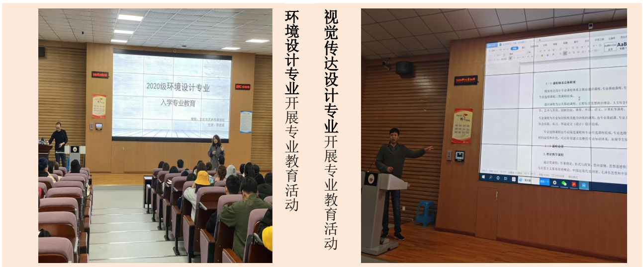
视觉传达设计专业开展专业教育活动 环境设计专业开展专业教育活动

为使同学们更快适应大学生活，了解专业特色，树立人生方向，2020年10月20日下午，文化与艺术传媒学院视觉传达设计专业与环境设计专业，分时段组织2020级新生在3J103阶梯教室开展入学专业教育工作。学院领导代表全院老师表示亲切而热烈的欢迎，教师代表就专业特色、课程设置、就业方向及人才培养方案的设计方面向新同学进行了专业、细致的分享，具体包括专业特点、怎样学习、就业方向等。在场师生面对面交流中又对同学们提出的疑问进行一一解答，帮助学生全面、立体的认识专业特色，明确未来的发展方向，培养良好的学习习惯，制定清晰有效的学习计划，坚定走上设计道路的信心。通过本次入学教育，建立了学院、教师、学生之间良好的沟通，为今后教育教学工作的设计与开展打下坚实的基础。