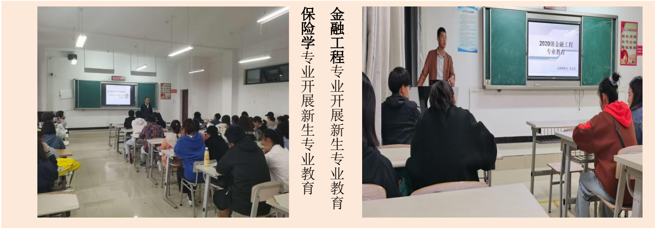
金融工程专业开展新生专业教育 保险学专业开展新生专业教育