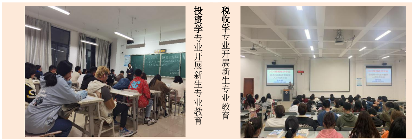
投资学专业开展新生专业教育

为全面贯彻落实我校“新商科本科教育教学综合改革方案”，不断强化人才培养中心地位，全面提升我校教育教学水平和人才培养质量，2020年10月下旬财政金融学院投资学专业、税收学专业、金融工程专业、保险学专业面向2020级新生开展了“新商科本科教育教学人才培养”讲座。这次专业教育讲座使同学们明确了自己的目标方向，知道自己未来该做什么、学习什么，对学校的新商科本科教育教学改革方案以及专业人才培养方案有了深入的理解，并表示努力学习，积极参加各项教育教学改革活动，以实际行动配合支持学校的改革举措。