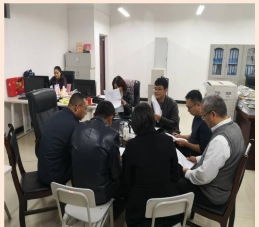
投资学教研室开展实践教学研究活动