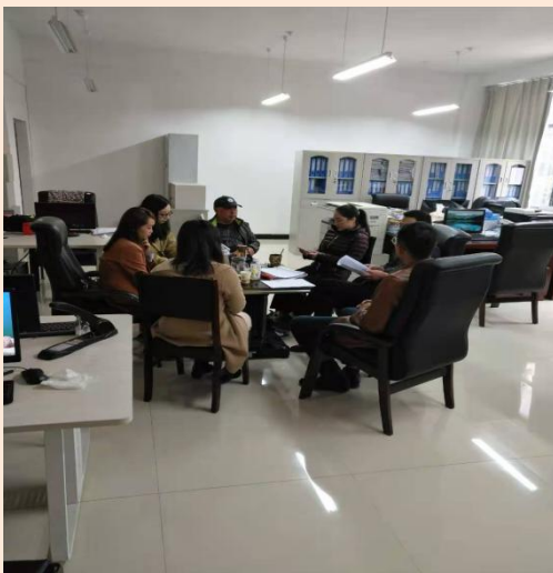
金融工程教研室开展实践教学研究活动