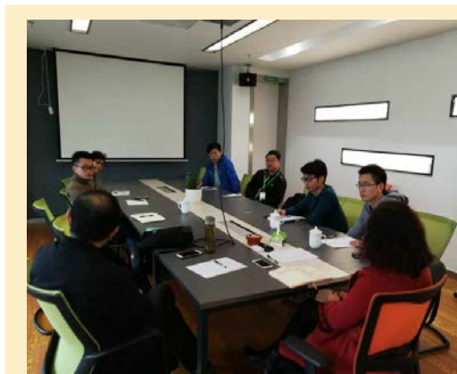
图二：物联网技术教研室到贵阳车秘科技有限公司参观考察，共同研究人才培养问题。

贵阳车秘科技有限公司参观考察，双方还就人才培养，教材合作编写进行研讨，公司技术人员还对年轻教师进行技术指导培训，促进教师实践教学能力的提升。