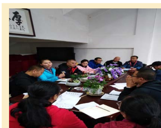
图一 大学体育教研室组织老师们共同学习研讨《篮球最新规则》

1、体育部大学体育教研室开展以“篮球最新规则解读”为主题的教研活动。本次教研活动对提高体育教师的业务技能有很大的帮助，有效提升了体育教师的整体水平，对今后从事篮球教学活动特别是担任裁判工作打下坚实的基础。