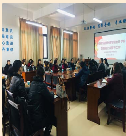
组织教师到贵州财经大学会计学院交流学习