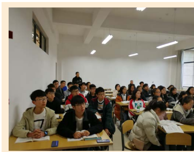
计算机基础教研室开展新进青年教师公开课教研活动

4、计算机与信息工程学院计算机基础教研室为培养年轻教师，2018年11月26日开展新进青年教师公开课教研活动。教研活动包括听课和评课两个环节。此次活动使授课教师明确了进一步努力的方向和途径。