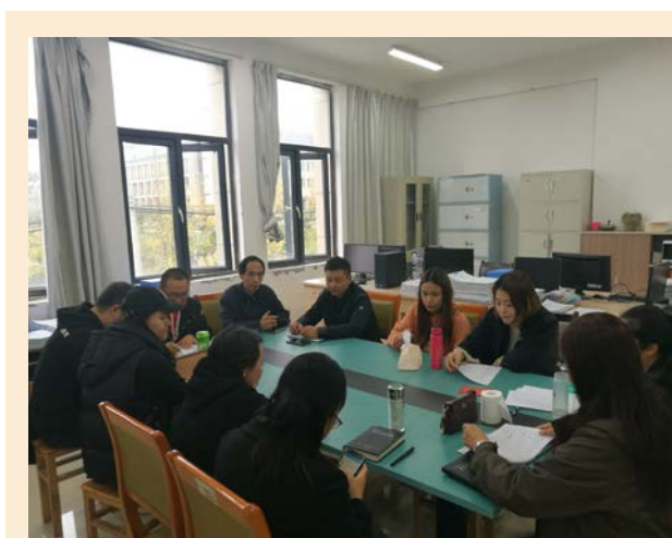
环境设计教研室开展“环境设计专业教学设备调试与演示”主题教研活动

3、艺术传媒学院环境设计教研室于2018年11月18日以“环境设计专业教学设备调试与演示”为主题开展教研活动。本次教研活动通过设备的展示和使用方法探究，锻炼了老师们的动手能力，增强了老师们办好专业的信心和决心。