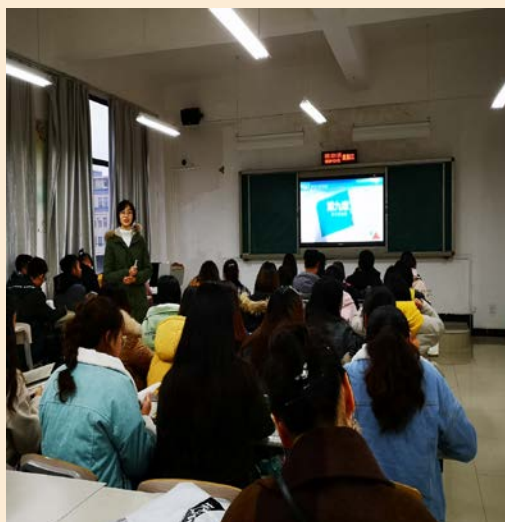
会计教研室开展青年教师试讲教研活动

6、会计学院扎实有效开展教育教研活动。一是会计教研室开展“一带一”青年教师试讲教研活动，帮助年轻老师规范教学环节，提升教学水平。通过教师们的评述，年轻老师掌握了教学基本环节的联系以及备课授课技巧；二是组织教师到贵州财经大学会计学院交流学习。双方围绕科研与学科建设、师资队伍打造等问题展开了深入交流。