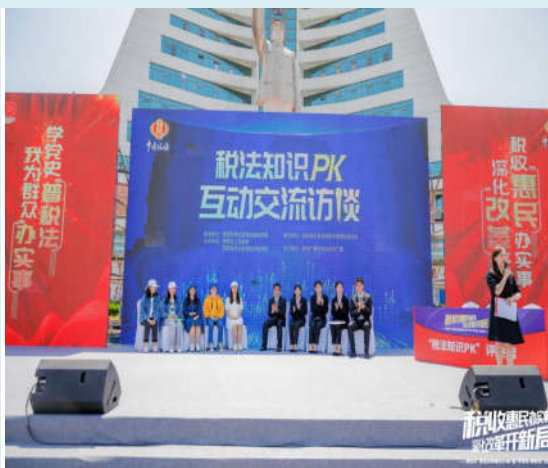
经济与金融学院教育、教学特色活动

在贵州商学院和贵州财经大学的现场税法知识竞赛中，我院学生以100:70的比分取得了胜利，荣获了“税务服务志愿集体”的表彰。最后在红色经典诗歌《七律·长征》的全场齐诵和《没有共产党没有新中国》的红歌声中，本次活动圆满落幕。